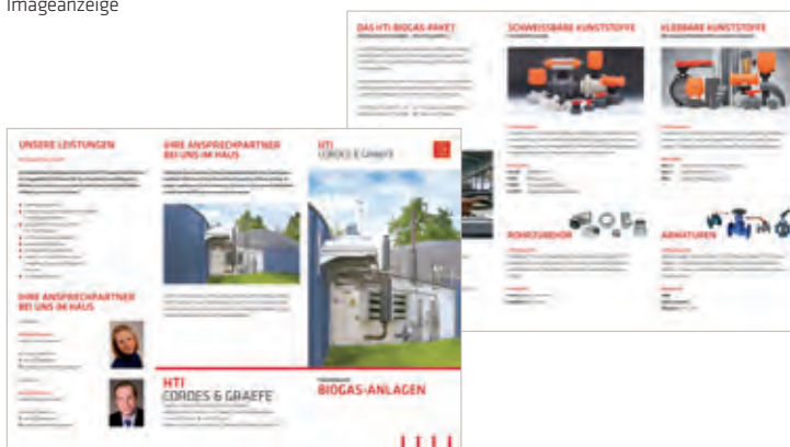
Flyer DIN-lang 6-Seiter